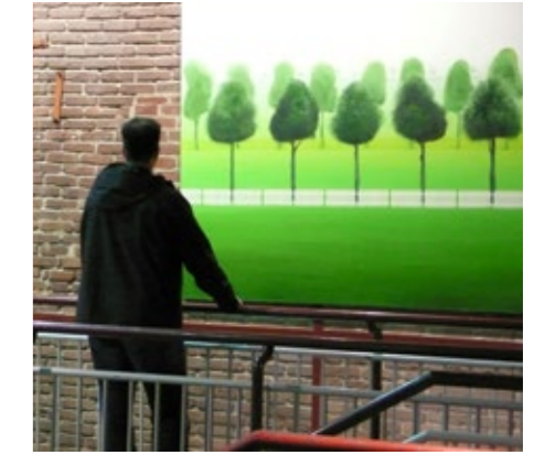
Humorvoll: Tegtmeiers Erben (links) bringen das Publikum zum Lachen. Stimmungsvoll: Der Kalender „Herner Ansichten“ (Mitte) verführt zum Träumen. Kunstvoll: Die KUBOSHOW bietet jungen Künstlern den Einstieg in den Markt. Und die Stadtwerke Herne sind dabei!

mit Energie im Erwachsenenalter eine Selbstverständlichkeit. In vielen Kindergärten und Schulen gehören Spiele und Unterrichtseinheiten zu den Themen „Energie“ und „Wasser“ bereits dazu; die Stadtwerke Herne unterstützen Erzieher und Lehrer, indem sie anschauliche Unterrichtsmaterialien zur Verfügung stellen. Vom Malbuch für die Kleinsten über Hör-CDs und computergestützte Lernspiele bis zum ausleihbaren Solarkoffer mit Experimenten zur Fotovoltaik reicht die Palette. Um schon dem Nachwuchs Energie- und Effizienzthemen näher zu bringen, kommen im Auftrag der Stadtwerke Energieexperten in die Schulen. Im Rahmen des sogenannten „Umweltunterrichts“ besuchen sie die vierten Klassen der Herner Grundschulen und gestalten Unterrichtseinheiten zu Themen wie „Woher kommt der Strom?“ oder „Erd- und Biogas“.