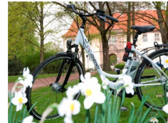
Die Elektromobilität erobert die Stadt – und die Parks. An der Künstlerzeche können Herner Bürger Pedelecs auch ausleihen.

GmbH aus Unna als Ideengeber, Projektmanager und Gesellschafter kooperieren die Stadtwerke Herne mit den Stadtwerken Bad Salzuflen, Rotenburg (Wümme), Verden (Aller) und Witten.