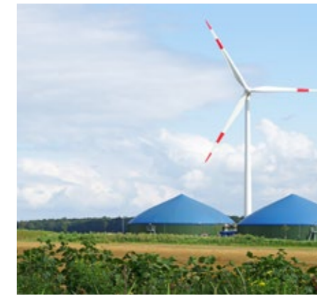
Energie aus Windkraft und Biomasse sowie Biogas, Wasser, Solar- und Geothermie bündelt „Green Gecco“ – ein Gemeinschaftsprojekt der Stadtwerke Herne mit 29 weiteren Energieversorgern.

Die Deutsche Energie-Agentur (dena) zeichnete den ersten Biogas-Pool für Stadtwerke im Rahmen eines Wettbewerbs mit der „Biogaspartnerschaft des Jahres 2011“ aus. Damit unterstreicht die dena nicht nur die Bedeutung effizienter, umweltfreundlicher und CO 2 -neutraler Produktion von Energie als Alternative zur Ressource Erdgas. Sie hob auch die Innovationskraft der partnerschaftlichen Zusammenarbeit der Beteiligten hervor: Neben der Arcanum Energy Management