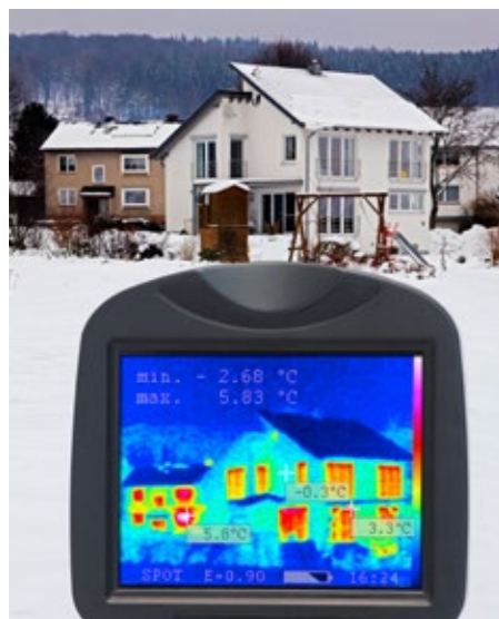
Wo dringt Wärme nach draußen? Thermografie-Aufnahmen zeigen deutlich die Schwachstellen einer Gebäudehülle.

Die Stadt Recklinghausen will in den Strommarkt einsteigen und plant eigene Stadtwerke. In einer europaweiten Ausschreibung suchen sie einen strategischen Partner, der sich an den neu zu gründenden Stadtwerken beteiligt. Ende 2011 haben sich daraufhin die Stadtwerke Herne und die Hertener Stadtwerke zu einer Bietergemeinschaft zusammengeschlossen und eine gemeinsame Bewerbung für eine 49-Prozent-Beteiligung abgegeben. Mit dem Zusammenschluss stünden Recklinghausen kompetente Partner in der Energieversorgung sowie starke Nachbarn aus der Region zur Seite. Am 21. November 2011 ging die gemeinsame Bewerbung mit einem ersten indikativen Angebot in Recklinghausen ein. Mit dem Konzept konnte sich die Bietergemeinschaft für die nächste Runde Anfang 2012 qualifizieren. Das Verfahren ist noch nicht abgeschlossen.