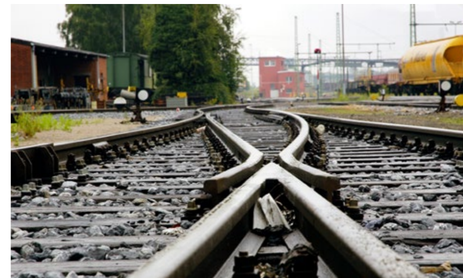
Die Weichen werden neu gestellt: Die Wanne-Herner Eisenbahn und Hafen GmbH (WHE) soll in den nächsten Jahren zu einem modernen Logistik-Unternehmen entwickelt werden. Dafür wurden unter anderem der Neubau eines Container-Terminals und der Ausbau der Trailer-Flächen projektiert.