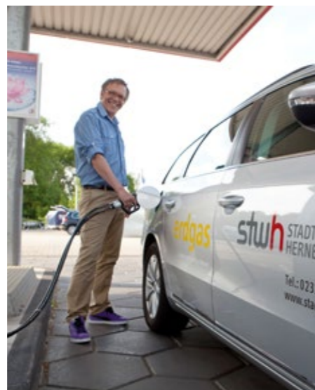
Wer ein mit Erdgas betriebenes Fahrzeug anschafft, wird von den Stadtwerken mit einem Extra-Förderbonus belohnt und und tankt in Herne ein halbes Jahr lang kostenlos.